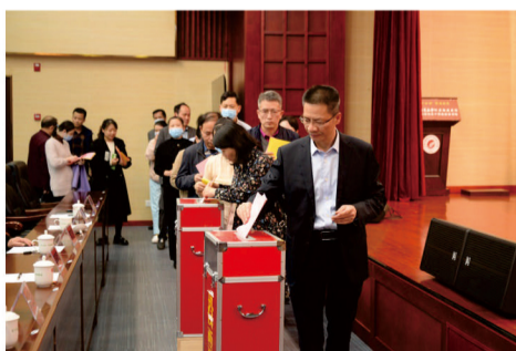
与会人员进行民主测评投票

随后，与会人员根据医院领导班子2023年度述职述廉报告和平时工作表现，对医院领导班子成员的德、能、勤、绩、廉等方面综合表现情况、履行党风廉政建设责任制情况及2023年度党委书记抓基层党建工作专项考核进行了测评。