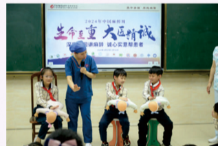
学生上台亲身实践