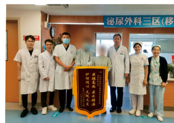
舒警官及家人为医护团队送上锦旗