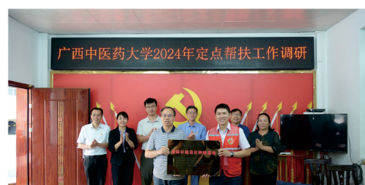
骨碎补规范化种植基地授牌仪式