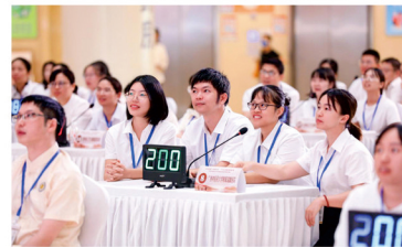
我院选手在比赛中