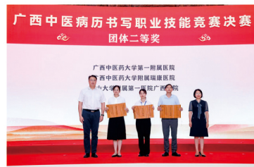
我院获团体二等奖

务人员辛勤付出的最好回报。医院将以此为契机，进一步加强医疗质量管理，提升病历书写水平，不断提高医疗服务水平，为广大患者提供更加优质、高效、安全的医疗服务。（邢沙沙）