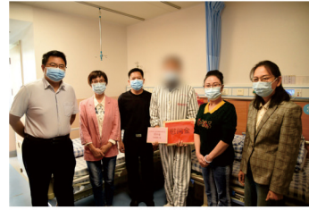
百色市公安民警抚恤协会送上慰问金

随后，大家一同参观了我院的治未病中心、国医堂、中医药博物馆等特色科室，并与医护人员深入交流。（张佳婕）