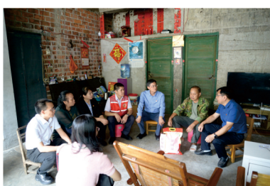
到村民家中走访慰问