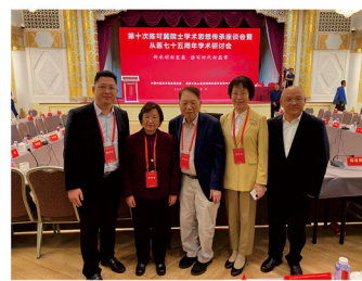
陈可冀院士、陈维养教授伉俪与唐红珍院长一行合影

陈可冀，中国科学院院士，国医大师，中国中医科学院、中国中医科学院西苑医院首席研究员及终身研究员。擅长治疗心血管病和老年病，是中国中西医结合的奠基者及开拓者，曾获国家科技进步一等奖，国家科技进步二等奖，爱因斯坦世界科学奖。在陈可冀院士的指导下设在广西中医药大学附属瑞康医院的广西中西医结合陈可冀院士工作站经过多年的发展建设，也取得了可喜的成绩，为医院科学研究、学科建设、人才培养、学术交流等提供了有力支撑。(姜枫)