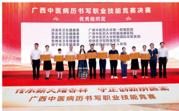
我院获优秀组织奖