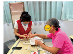
乳腺病科患者制作蝶古巴特手提包