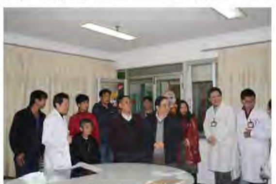
领导到消化内科慰问医护人员。

春风暖人心，祝福增干劲。2013年是医院全面贯彻落实党的十八大精神的开局之年，是实施“十二五”规划承前启后的关键一年，是我院全面建设全国一流中西医结合医院的关键一年，院领导的亲切慰问使广大干部职工深受鼓舞，他们纷纷表示：在新的一年里，将以十八大精神为指导，振奋精神，凝聚力量，攻坚克难，以全新的姿态迈上医院新的发展平台。