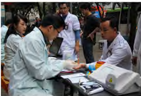
医院医护人员积极献血。

渐入深冬，年关将至，南宁市用血持续紧张。近日邕城气温陡然回暖，我院职工的献血热情也伴着气温浓烈起来。为了