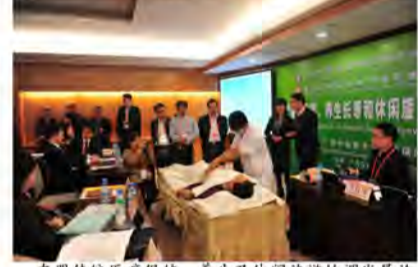
东盟传统医药保健、养生及休闲旅游协调发展论坛现场展示中医药