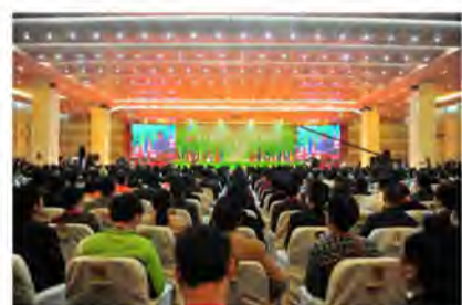
2013年中国-东盟传统医药高峰论坛暨第五届中国(玉林)中医药博览会开幕式盛况

论坛由国家中医药管理局、国家民族事务委员会、广西壮族自治区人民政府共同主办,广西中医药大学参与承办,主要包括开幕式、巡展体验、政府论坛、4个分论坛等活动。其中,我院承办传统医疗保健、养生和休闲旅游协调发展分论坛。此次论坛上,各方专家达成共识,即传统医药和健康产业及休闲旅游合作方面有着广阔的前景,未来在传统医药休闲旅游方面中国和世界各国将加强沟通和协作。此次论坛亦成为各方分享成果、交流学术的舞