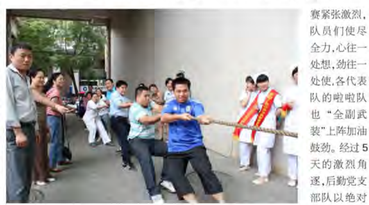
后勤党支部代表队获得冠军

为了迎接“五一”国际劳动节,丰富职工的业余文化生活,增强职工的集体荣誉感,医院工会举办了职工拔河比赛。本次比赛以党总支、党支部为单位组队,共有12支代表队参加了比赛。比赛紧张激烈,队员们使尽全力,心往一处想,劲往一处使,劲往一处使,啦啦队也“全副武装”上阵加油助威。经过5天的激烈角逐,后勤党支部队以绝对的优势勇夺冠军,外科党支部、门诊急诊支部、南院分院党支部分别荣获亚军、季军、第四名。比赛结束后,庞刚副院长给获奖队伍颁发奖杯及奖金。(文:郑莹)