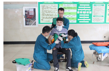
常态化开展急救演练

练在经常，贵在坚持。为提高医护人员的临床基本理论知识和临床技能，让医疗业务培训成为常态化制度化的动力引擎，医院制定相关规章制度，激励青年医师立足本职工作，争当岗位能手。医院新入职的临床医师都必须经过临床技能操作测试才允许上岗，其中心肺复苏操作为必考内容，内科及外科专业的人员加考气管插管，考试不合格人员必须补考通过才能参与临床工作。从2007年开始医院坚持每年开展临床技能大赛，至今已开展11届，坚持开展医师技能竞赛，一年两次三基考试，开展外科手消毒技能培训活动，每年开展不同场景的急救演练活动，每季度开展一次心肺复苏、气管插管、除颤等临床技能培训等一系列活动，旨在培养医护人员医疗专业素养及应急处置