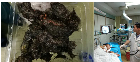
胃中取出的头发结石

农医生说,“这个小女孩是因为食欲不好,而且老是腹部不适,在一次晚饭后家人发现她肚子胀得鼓鼓的,等到晚上睡觉时,家人发现孩子的肚子还胀鼓着,就摸了一下小孩