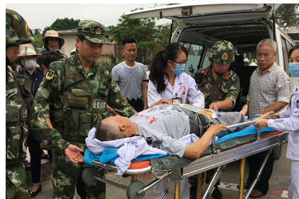
医院急诊科在中越边境开展跨国救治

娴熟的急救技能是抢救的基础，而每一次成功的救援也不是某人的独角戏，是全科力量、各科协作、相互配合而筑成的生命保障线，是多专家多学科多部门的联合救治，为患者生命保驾护航。急诊绿色通道、全科专家讨论、多学科专家联合会诊等救治体系，成功将一个个垂危的生命从死亡线上拉了回来。