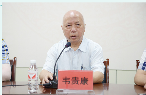
国医大师韦贵康教授致辞