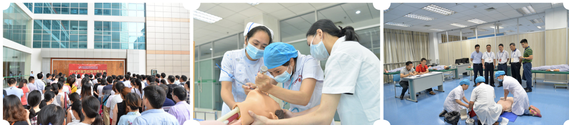
大赛启动仪式现场