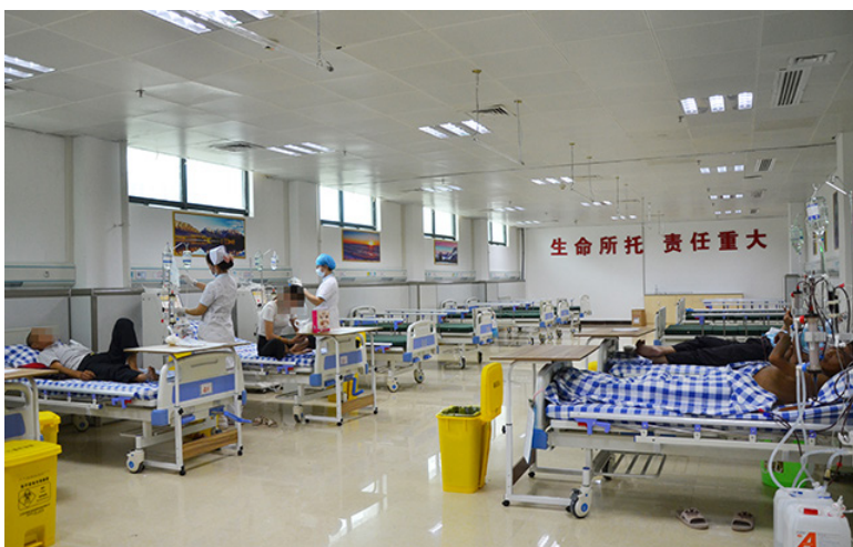
田阳院区血液净化中心

田阳院区血液净化中心建于院区门诊大楼4楼，占地300多平方米，布局合理，配备高通量透析机6台，反渗透处理设备一套。中心的开业，极大地缓解了全县广大肾病患者必须往返百色市区做治疗的困难，为革命老区人民群众的生命健康提供了坚实保障。（廖青）