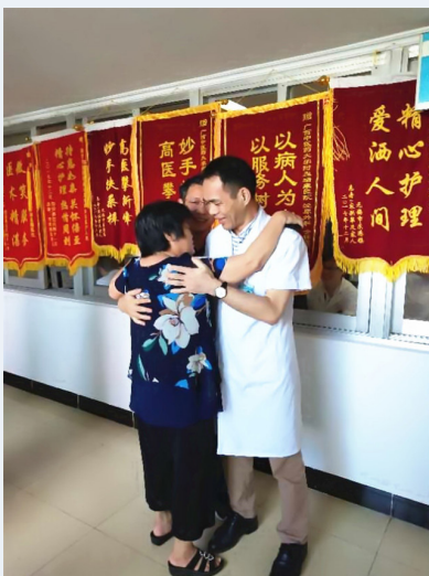
患者家属抱着医护人员喜极而泣