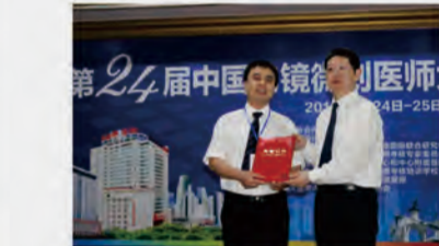
胃肠外科分论坛—颁发学术演讲证书