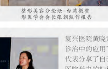
整形美容分论坛—台湾微整形美容医学会会长张朝凯作报告