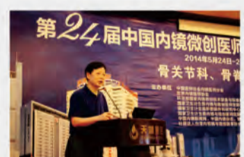
骨科分论坛—我院骨科梁主任负责有梁教授致词