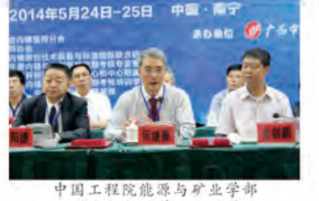
中国工程院能源与矿业学部副主任何继善院士致词