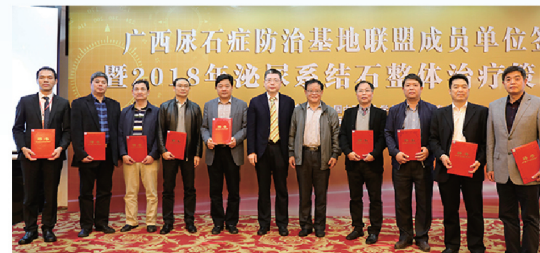
主任委员、副主任委员合影