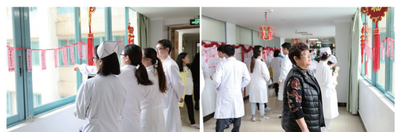
医护人员参与其中