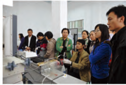
广西妇科微创手术新进展研讨会：手把手培训班学员