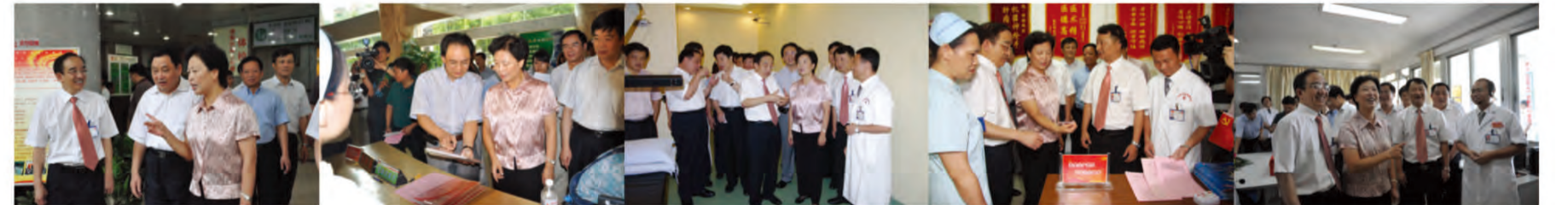
陈际瓦副书记与学院党委书记朱华、我院院长梁健亲切交谈

通过视察，陈际瓦对瑞康医院的三句话“立足于学、聚焦于干、致力于帮”表示赞赏。她指出，我们各事业单位就是要以谋划中心工作和创先争优活动有机结合起来，使我们的活动更加贴近工作实际，这样来设计我们的主题，来搭建我们的载体，这些活动的目标一定要看得见、摸得着，党员好参加，各自形成有行业特色、有岗位特点的活动，使创先争优活动更生动、更扎实。我国的中医药博大精深，跟先进的西医结合在一起，中西医结合对我国的医疗卫生事业起到非常大的作用。希望瑞康医院应该大力发展中西医结合的诊疗技术，更好地为老百姓服务。