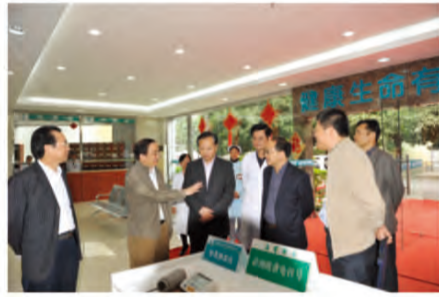
我院梁健院长向卫生部妇社司秦怀金司长介绍南棉社区情况