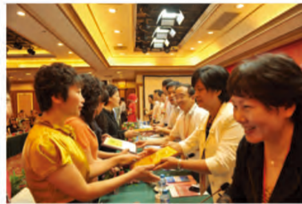
领导为获奖代表颁奖