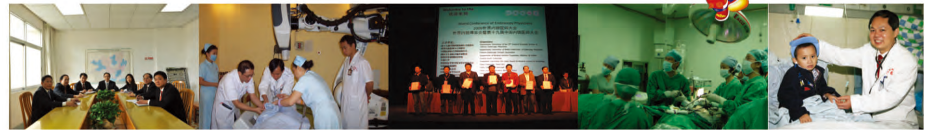
团结务实的医院领导班子

2010年医院业务收入稳步增长, 较2009年增长31.85%, 各项业务指标均创下历史新高, 瑞康医院“名医、名科、名院”品牌效应初步形成。