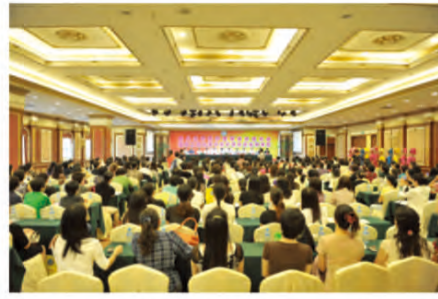
第八次全国中医护理学术交流暨第二届全国中医护理先进集体表彰大会现场