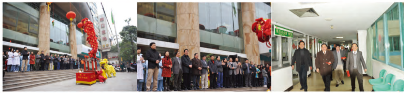
兔年春节来临, 舞龙舞狮给瑞康医院增添了喜庆气氛