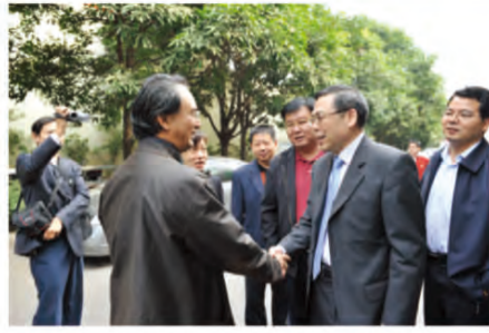
卫生部刘谦副部长与广西中医学院院长唐农博士亲切握手

秦司长指出，深化医药卫生体制的改革，需要国家、医院和社区三方面的共同努力，要吸引老百姓在社区卫生服务中心看病，应在政策导向，财政医保措施上让老百姓看病方便、实惠。秦司长表示，调研结束后，他会将南棉社区卫生服务中心基层医疗机构反映的关于综合医改，国家基本药物制度实施院内中药产品，制剂配备使用等问题上报卫生部，从而推进医改进程。