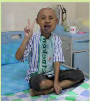
大舌娃治疗后照片