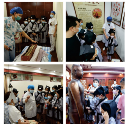
走进诊室近距离感受中医疗法

建设、开放接待和队伍建设等工作，进一步开展好中医药文化宣传教育工作，推进中医药事业全面协调发展，让中医药发展成果惠及广大人民群众，为健康中国贡献更大力量。（陶柳琰）