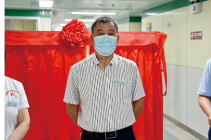
韦思尊副院长出席仪式并讲话