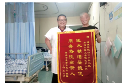
患者为消化内科二区团队送上了锦旗

维得利珠单抗是一种人源化单克隆抗体，用于治疗对传统治疗应答不充分、失应答的克罗恩病和溃疡性结肠炎。通过与 \alpha 4 \beta 7 整合素特异性结合，维得利珠单抗可以阻断 \alpha 4 \beta 7 整合素与MAdCAM-1相互作用，抑制记忆T淋巴细胞穿过内皮迁移至胃肠道的炎症组织，从而精准抑制