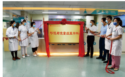
为“呼吸与危重症医学科”揭牌