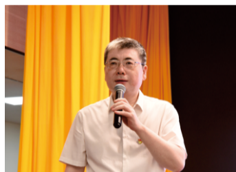
高宏君书记致辞并授课