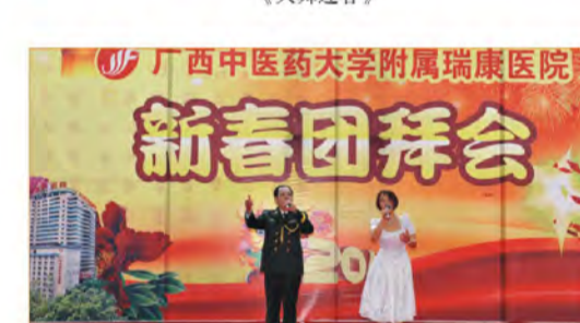
男女对唱《祝福祖国》