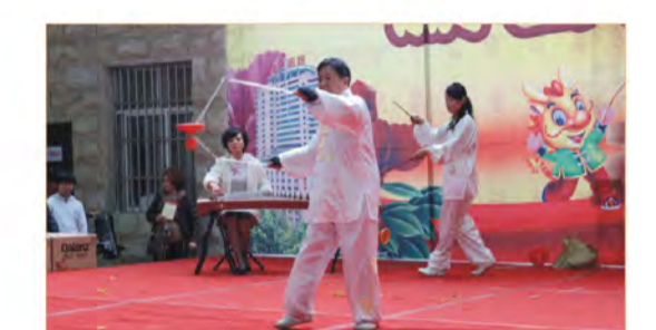
古筝空竹表演《茉莉花》