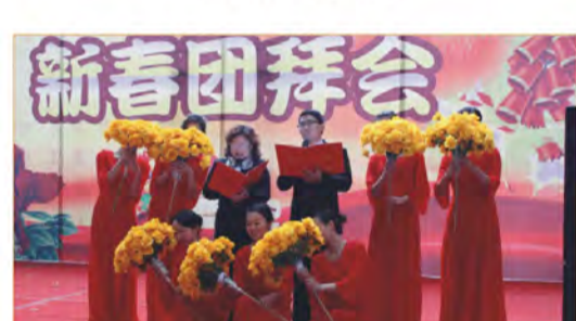
配乐诗朗诵《我的祖国》