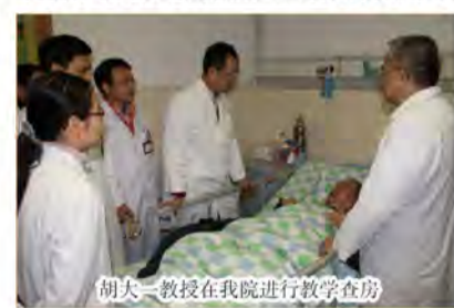
胡大一教授在我院进行教学查房

下午，胡大一教授在我院心血管一区进行教学查房，为患儿进行检查，并进行了病例讨论。