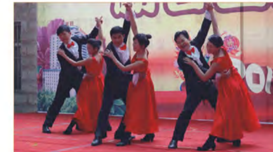
歌伴舞《我和我的祖国》