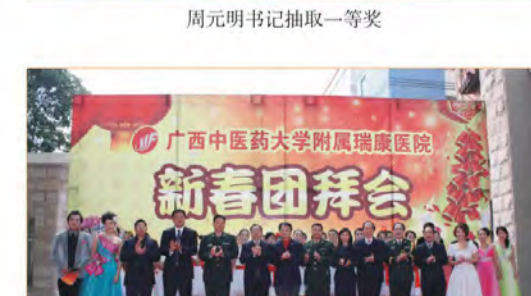
医院领导与演出人员合影