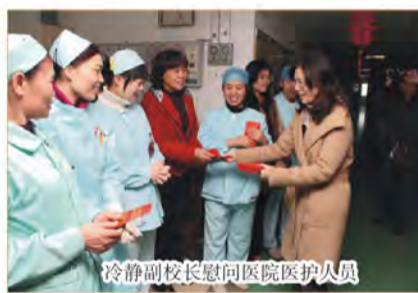
冷静副院长慰问医院医护人员

据了解, 为了让大家过一个欢乐、祥和、平安的春节, 我院有许多员工在除夕夜至春节长假期间坚守在临床一线, 他们以自己的无私奉献换来万家欢乐, 学院及医院领导向他们表示节日的问候, 祝新春快乐、万事如意。