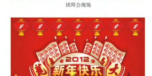
医院领导祝我院所有工作人员新年快乐