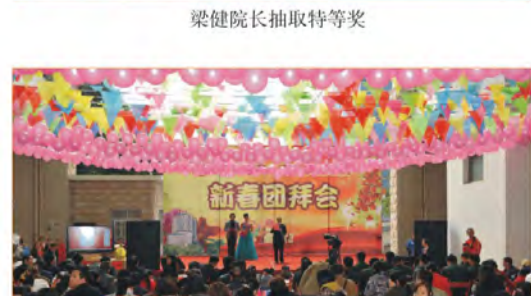
热闹的团拜会新春