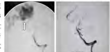
术前示右枕叶巨大动静脉畸形(AVM)术后AVM消失。

范博士介绍,动静脉畸形是常见的比较复杂脑血管疾病之一,早期诊断并合理治疗可以获得较好的预后;术中若处理不当,一旦大出血或者损伤重要神经结构,轻者留有神经功能缺损,重者有生命危险。AVM有开颅手术和介