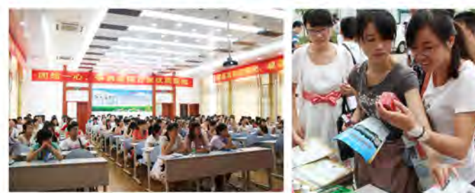
1.新员工在广西中医药大学新校区合影。2.新员工接受岗前培训。3.新员工了解中药研发基地制剂。

前在大学本科主修食品专业时,我便深感要提高一个民族人口的整体素质,硬件是人口健康素质,软件是文明素养,只有软硬件都得到提升,才有可能实现民族的崛起复兴。而现在,一想到从事的工作就是要将这些提高身体素质所接受的方式传播出去,也许能或多或少地影响到人们的养生观念和生