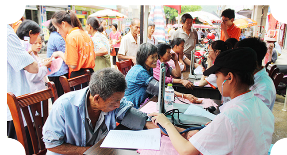
学生志愿者量血压