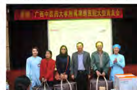
黄主任和2位护士长分别为透析5年、10年、20年的肾友们颁奖。