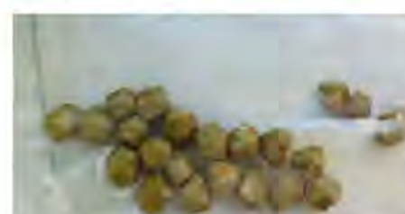
小韦体内取出的结石