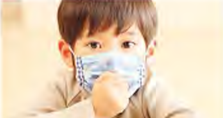
来复查,看看情况如何再用药,可有的家长给孩子吃了3天药,一看体温降下来,不发烧了,就自主停药,第二天又烧了再用药,好了就停药,其实这样并不利于治疗。