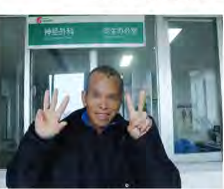
谢师傅病愈后开心留影。