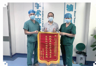
杨先生赠送 给手术麻醉科的锦旗