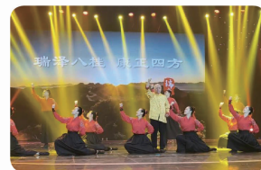
国医大师韦贵康参演