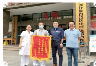
杨先生赠送 给医疗服务部的锦旗