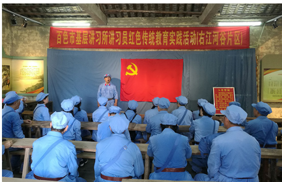
在邓小平真良旧居听老师介绍邓小平在田东革命活动情况

大家通过穿一套红军服、走一段红军路、坐一趟红军船、吃一顿红军餐、学唱一首红军歌谣、听一个红军故事、上一堂专题党课、重温一遍入党誓词等现场情景的体验，以历史追溯者的身份，置身于这段穿越时空的精神旅程，触摸着感染了烽火硝烟的红色印记。大家一致认为田东之行是一次思想震撼之旅，是一次心灵净化之旅，是一次红色革命精神的