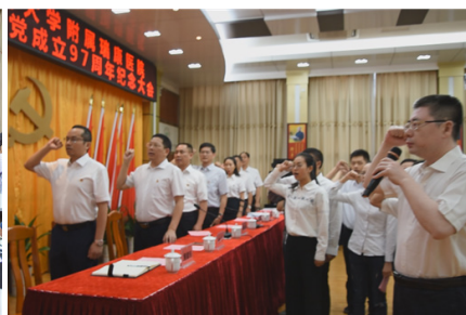
新党员入党宣誓、老党员重温誓词