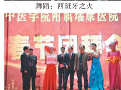
领导们抽取一等奖