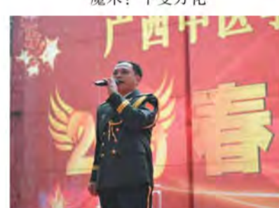
高炮团独唱: 中国功夫