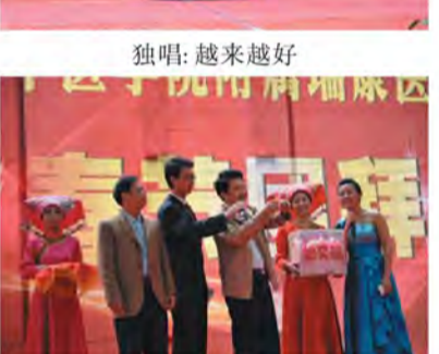
学院领导抽取特等奖