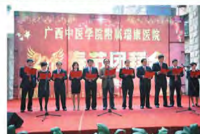
院领导合唱我们走在大道上