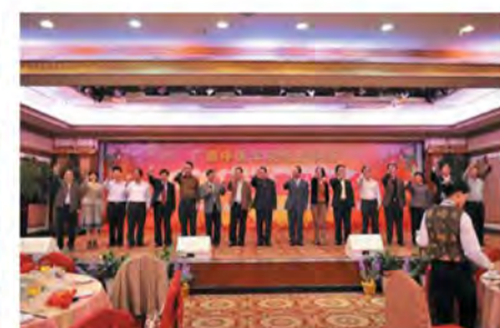
领导及嘉宾祝大家在新的一年里心想事成，万事如意