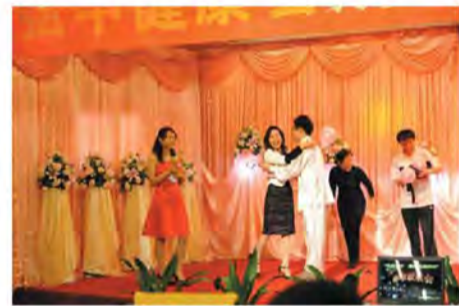
《夺宝奇兵》游戏的获奖喜悦