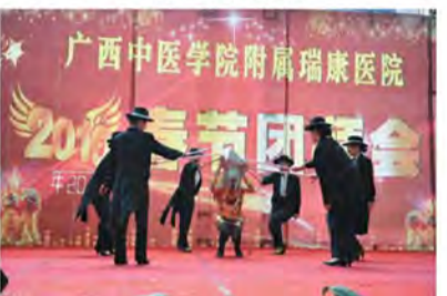
舞蹈: 钻石闪亮晶晶