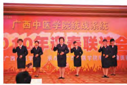
高校侨联与学院侨联礼仪展示