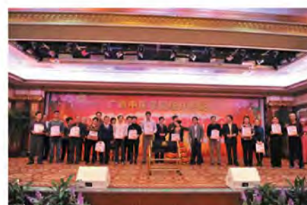
领导为中奖者颁奖