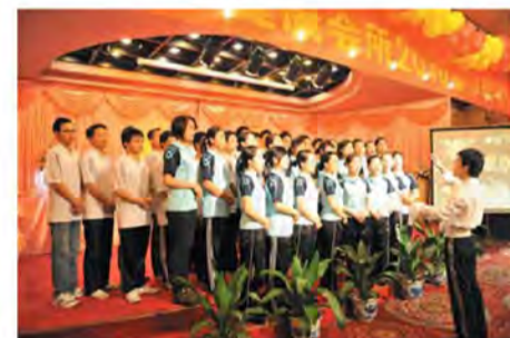
大合唱：明天会更好