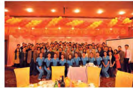
会所人员与领导合照