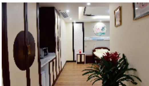
安全环保的装修材料

安全环保温馨舒适的住院环境为妈妈们提供了私密的住院环境和温馨的家庭氛围，病区内配备微波炉，24小时供应热水，护士站设有便民服务点，便利妈妈们的日常生活需求。