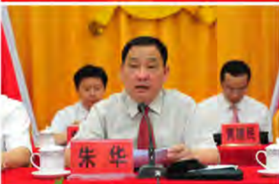
广西中医药大学党委书记朱华讲话。