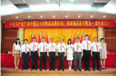
新一届党委、纪委委员。

疗质量，加快推进新医疗大楼和空港院区建设，努力提高职工生活水平，把我院建成全国一流中西医结合医院。 大会在庄严的《国际歌》声中闭幕。 (文：赵立春 覃华芳 郑莹 夏哲璇 杨杰)