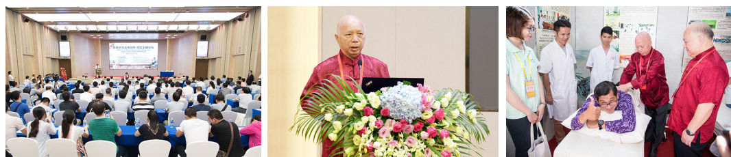
我院承办的传统手法交流合作高层主题论坛现场