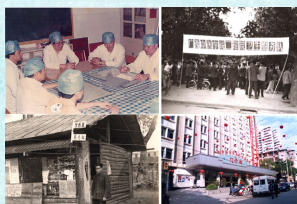
参展部分历史照片