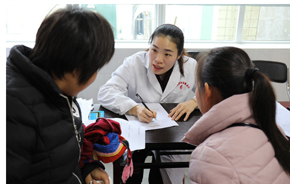
指导患儿家属填写申请表

有这样一支医德高尚、技术精湛的“救心”队伍，他们常年奔走在广西各地，深入贫困地区，普查救治先天性心脏病患儿，这十年，他们在“救心”的道路上，从未止步；这十年，他们完成各种心脏病手术突破 6000 例，他们拥有 6 项慈善救助先心基金，是目前广西最大的贫困先心病患儿救助平台，这些年来，他们的足迹遍布广西近 40 个县区，救助先心病患儿 3000 多人次，救助金额达 5000 万，广西贫困地区先心病患儿受益匪浅。他们就是广西中医药大学附属瑞康医院心胸外科的专家团队。