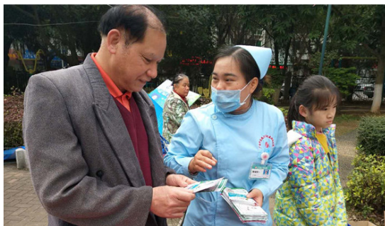
向居民宣教健康知识

1月13日,我院自治区级“青年文明号”——泌尿外科联合医院国医堂、中心药房、超声科等专业技术精湛的专家团队,带着相关检查设备、健康教育宣传资料,前往高新社区高新苑小区,为当地居民送去健康知识和义诊服务,受到了社区居民的热烈欢迎。