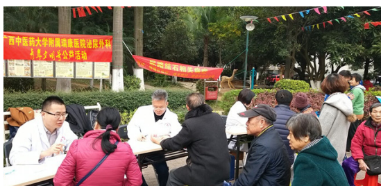
人头攒动的义诊现场