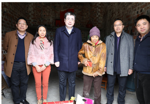
院领导走访慰问帮扶对象

医院领导分别在新盖村、念潭村村委召开座谈会，听取了两村的基本概况、村集体经济收益情况、群众